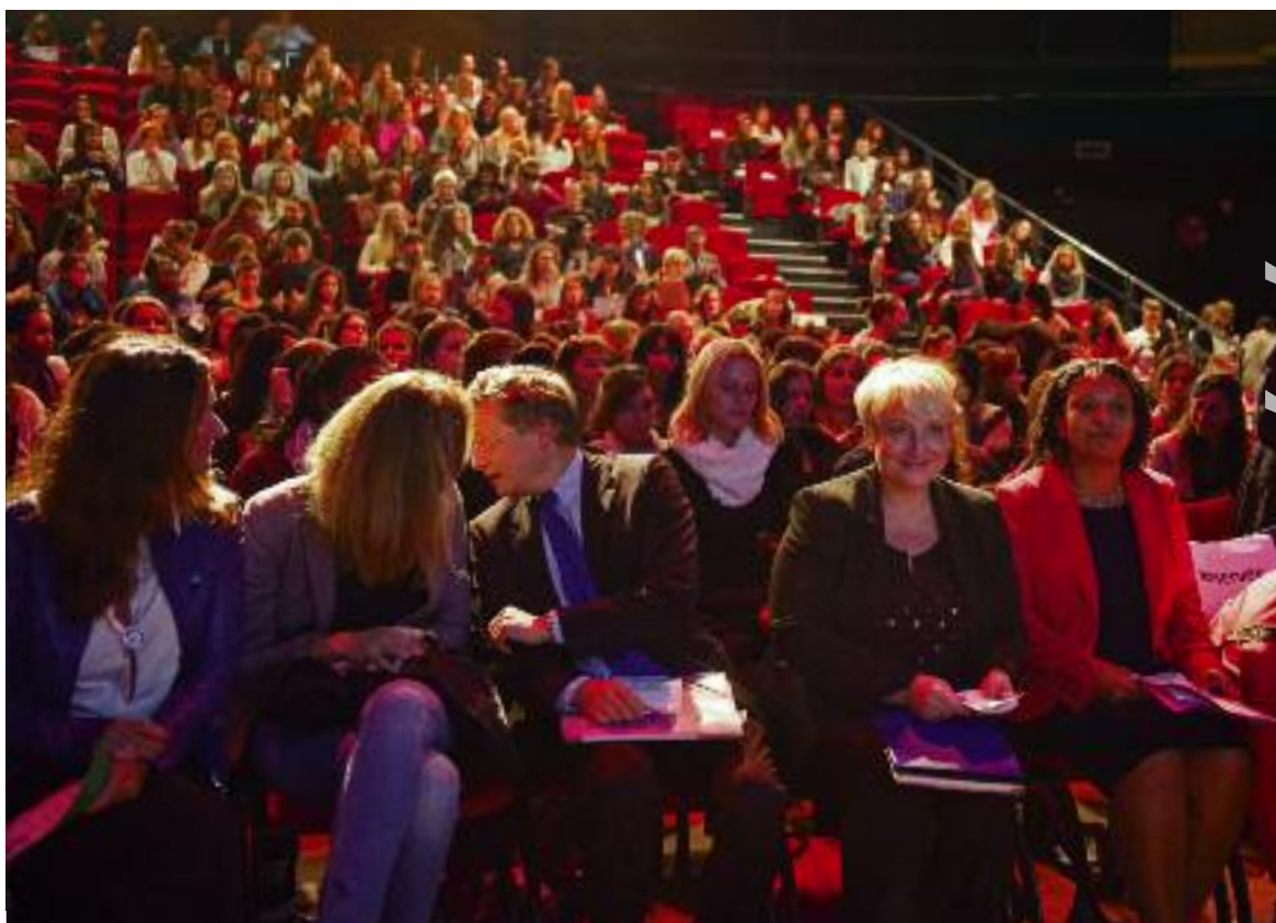
Plus de 300 lycéennes ont participé à l'après-midi d'échanges organisé au centre culturel communal Charlie-Chaplin.

"C'est un sujet très important de dire que tout est possible et qu'une femme peut prétendre à toutes les carrières", a rappelé Hélène Geoffroy, témoignant de son propre parcours à l'École nationale des travaux publics d'État, basée à Vaulx-en-Velin, où elle était la seule femme de son laboratoire de génie civil. "Il n'y a pas de sexe à l'avenir, il y a ce que nous voulons faire pour nous épanouir", a affirmé la secrétaire d'État en charge des Droits des fem-