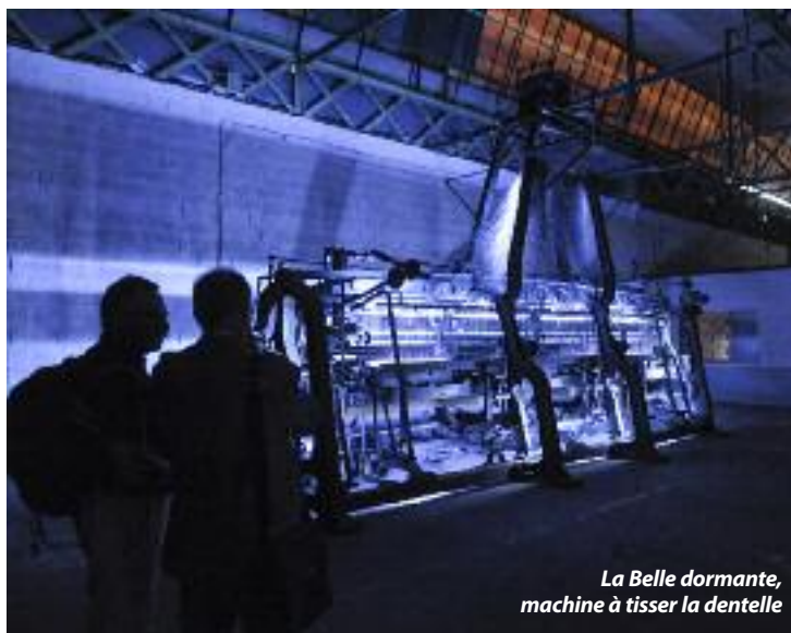
La Belle dormante, machine à tisser la dentelle