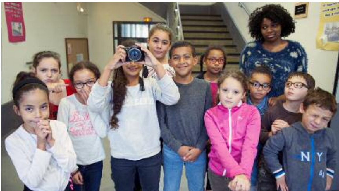
Les élèves de l'école Frédéric-Mistral découvrent l'univers de la photographie dans le cadre des activités périscolaires.