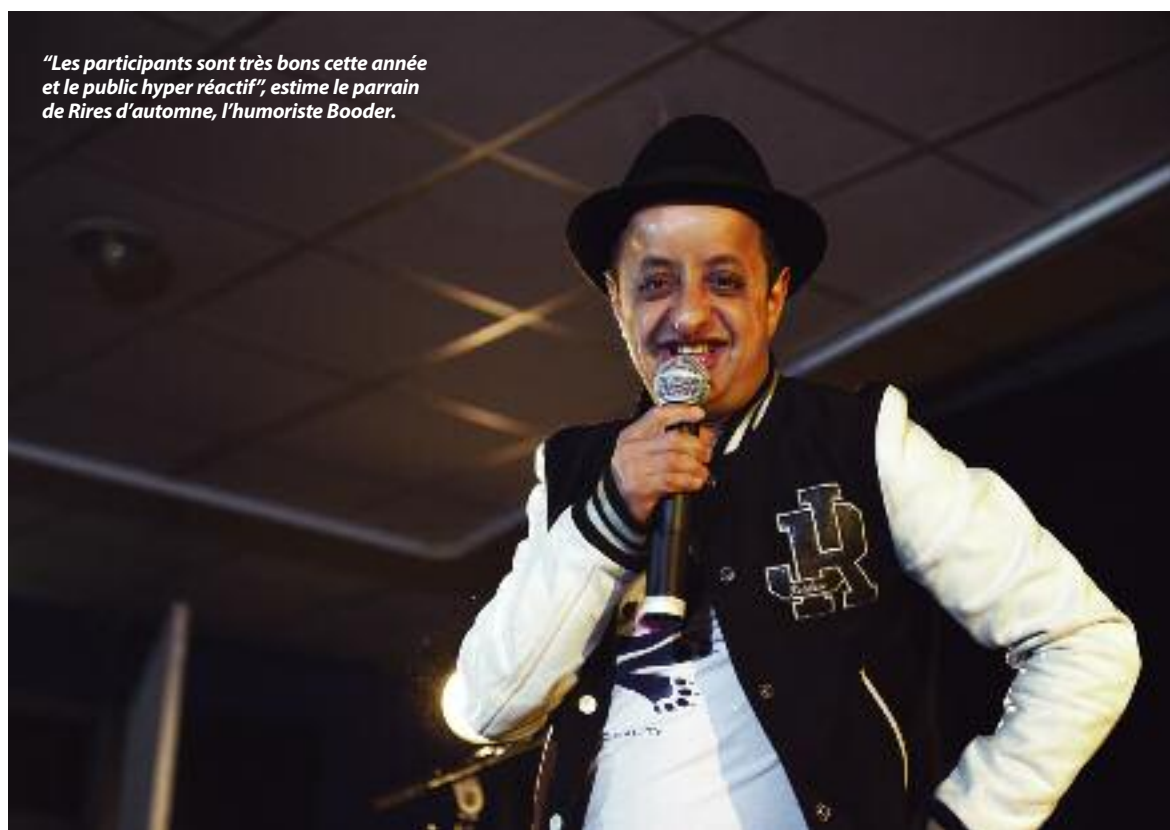
"Les participants sont très bons cette année et le public hyper réactif", estime le parrain de Rires d'automne, l'humoriste Booder.