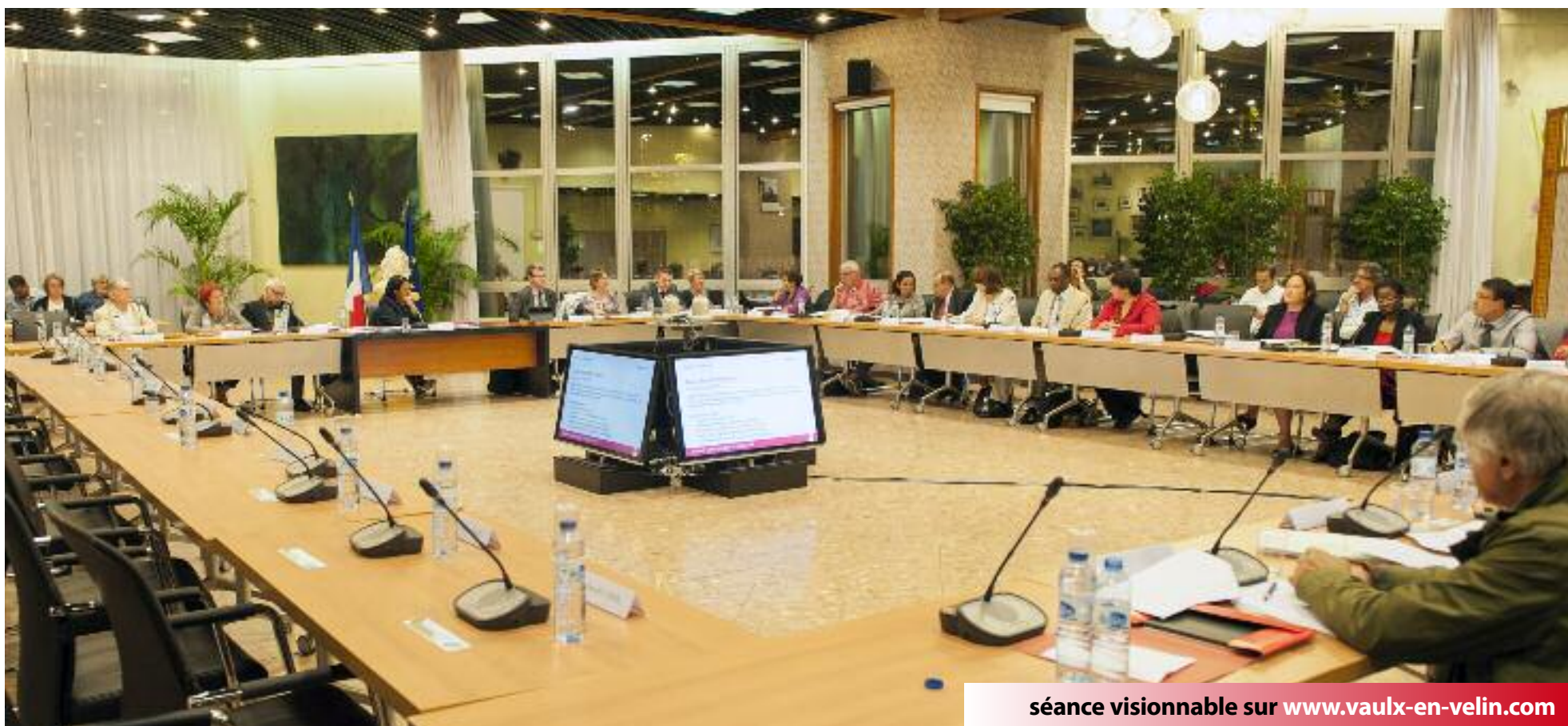
séance visionnable sur www.vaulx-en-velin.com